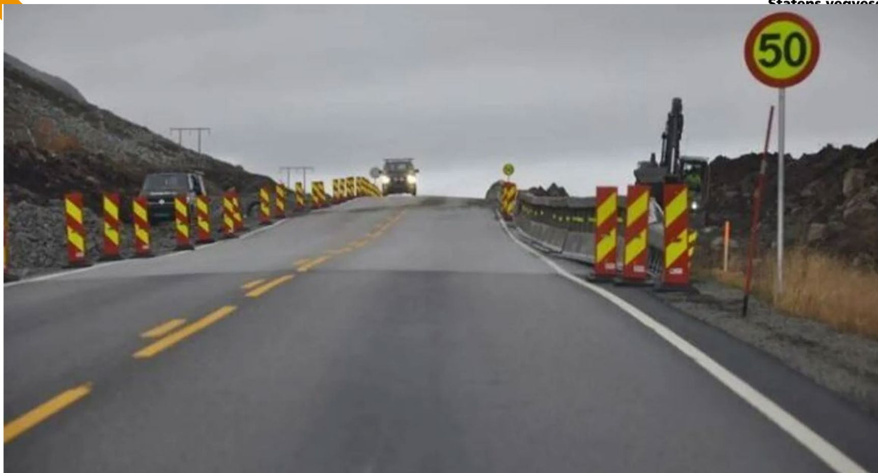
Det pågår arbeid tett på fire kilometer av riksvei 52 på Hemsedalsfjellet.