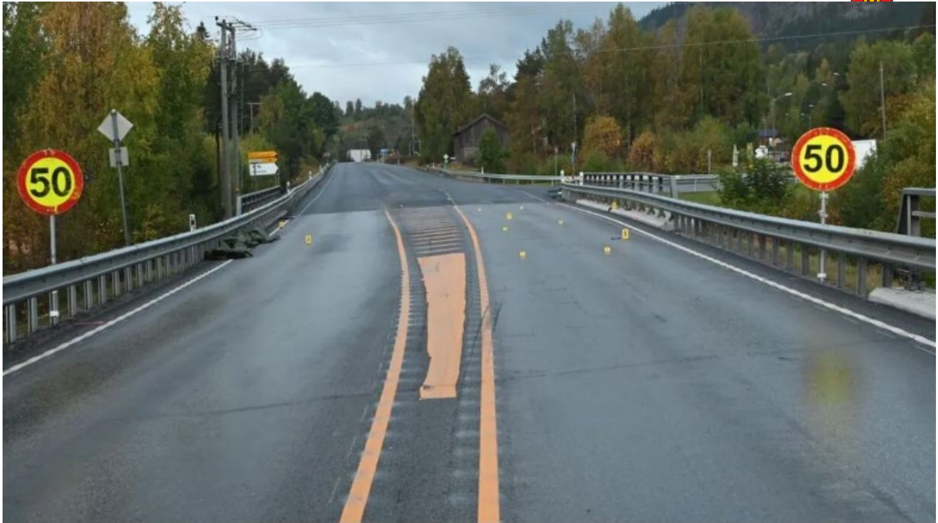
Jlykken da en trafikkdirigent ble drept skjedde her på riksvei 7 ved Ål i Hallingdal